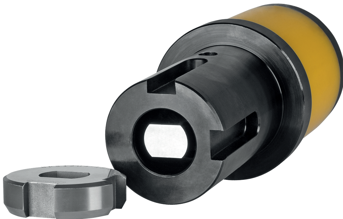
Locheinsätze, oval - Standardausführung: