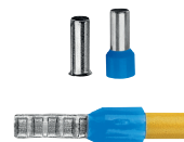
Форма обжима наконечника на проводе.