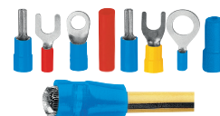
Форма обжима наконечника на проводе.