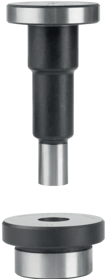
Locheinsätze, rund – Standardausführung